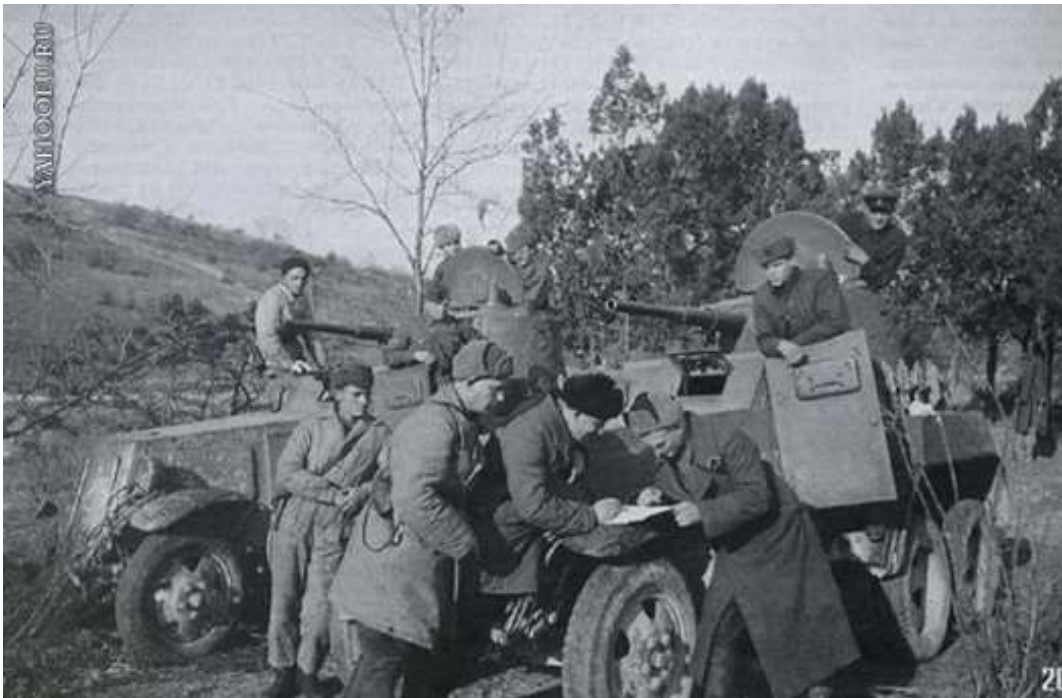
1943 – Начало крупного наступления советских войск в Правобережной Украине.